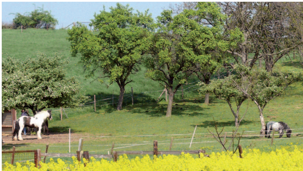
Unten: Obstweiden bei Ginnick