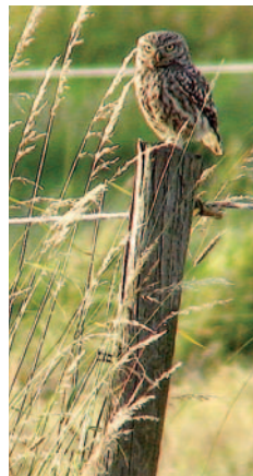
Rechts: Weidepfähle sind ideale Ansitzwarten

Steinkäuze leben in der heutigen Kulturlandschaft gefährlich. Viele enden als Verkehrs-