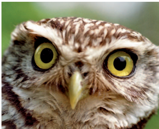
Der alte Kauz aus Thuir