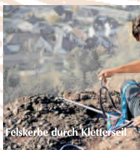
Felskerbe durch Kletterseil